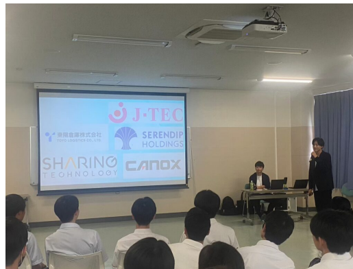
市邨高校にて講演会の様子