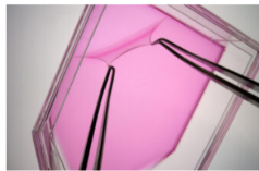
ジャパン・ティッシュエンジニアリング(J-TEC)