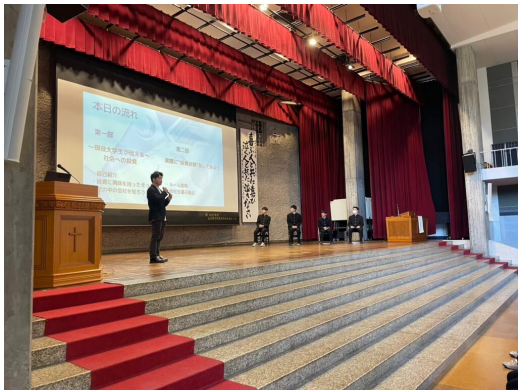
名古屋中学校にて 講演会の様子