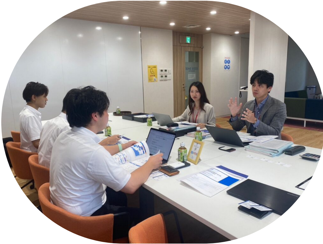
緊張しながらも取材をしているメンバーの様子

メンバーの大半は取材は勿論、記事作成、企業へのメール、株価の見方等、 全てが未体験からのスタートです！ 先輩達に教えてもらいながら一緒に学び、楽しみましょう！